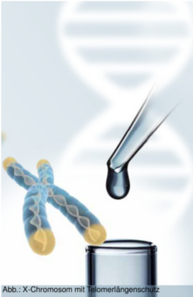
Abb.: X-Chromosom mit Telomerlängenschutz