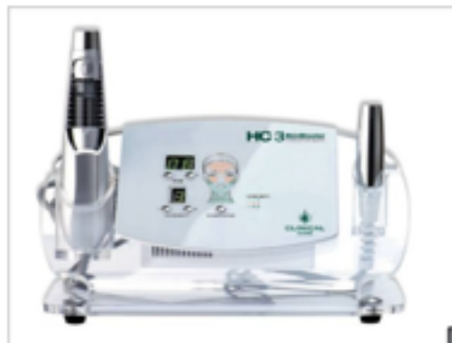
1º HC3 Skinshooter