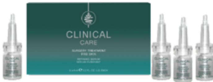
2º Productos profesionales Clinical Care