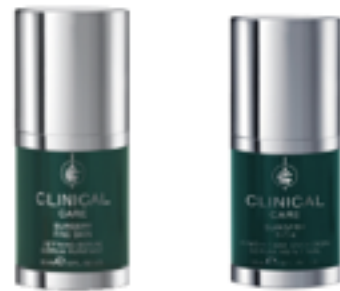
3º Productos de venta al público